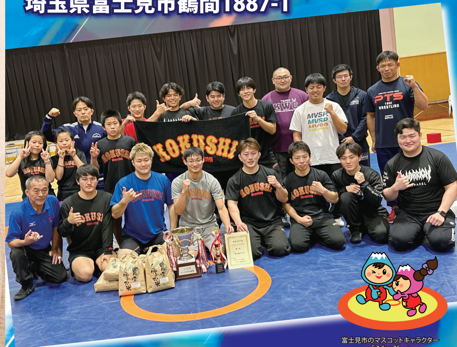
富士見市のマスコットキャラクター 「ふわっぴー」

期日:令和6年11月1日(金)~11月3日(日) 場所:富士見市立市民総合体育館 埼玉県富士見市鶴間1887-1