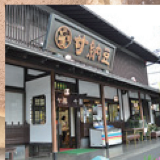
東浦和店 埼玉県さいたま市緑区東浦和6-30-7 048-874-2411