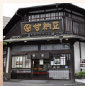
上青木店 埼玉県川口市上青木西4-16-7 048-269-1421