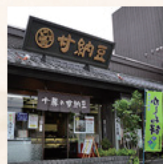
芝店 埼玉県川口市芝宮根3972-1 048-267-0147