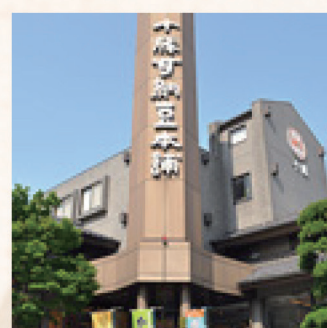
末広本店 埼玉県川口市朝日1-10-1 048-225-0147