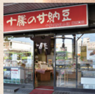
蕨西口店 埼玉県蕨市中央1-25-1 048-444-2650